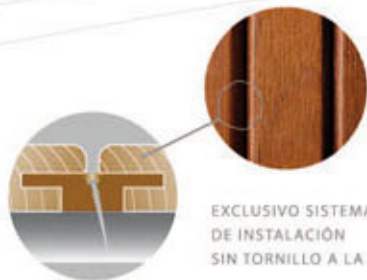
EXCLUSIVO SISTEMA DE INSTALACIÓN SIN TORNILLO A LA VISTA.