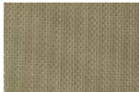
MALONE . 1006