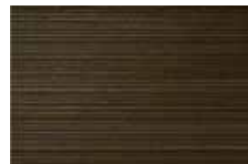
TRINITY . 1009