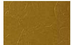
MALAWI . 1011