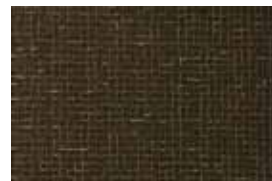
ROXEN . 1002