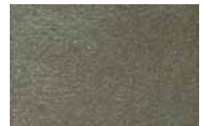
VALENCIA . 1008