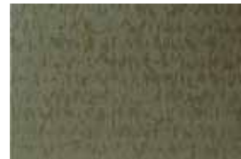
JORDAN . 1013