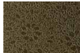
MONO . 1004