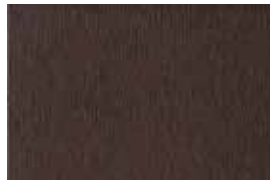
DETROIT . 1005

Cuenta con 12 diseños completamente distintos disponibles en una rica gama de colores y texturas. Es la colección perfecta para múltiples aplicaciones.