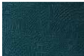
SUMMER . 1001