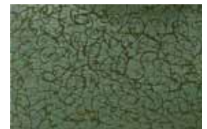
SAKA . 1007